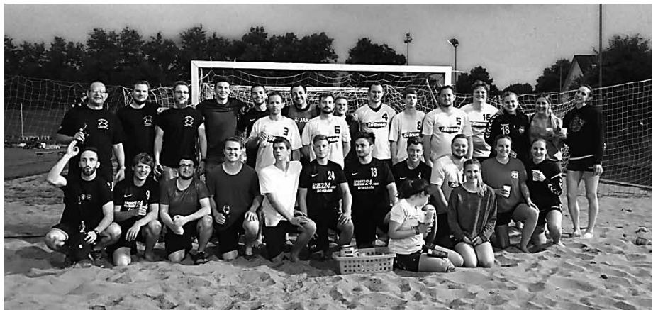
Herren auf dem Beachturnier in Walldorf

In den letzten Wochen der 1. Phase haben die HSG-Herren zusätzlich einmal pro Woche das Fitness-Studio in Schneppenhausen gemietet, wo sich die ambitionierteren Spieler eine gute Grundlage für die Saison schaffen sollen. Zu Beginn der 2. Vorbereitungsphase Ende